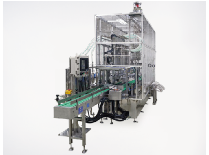
6連充填巻締ライン